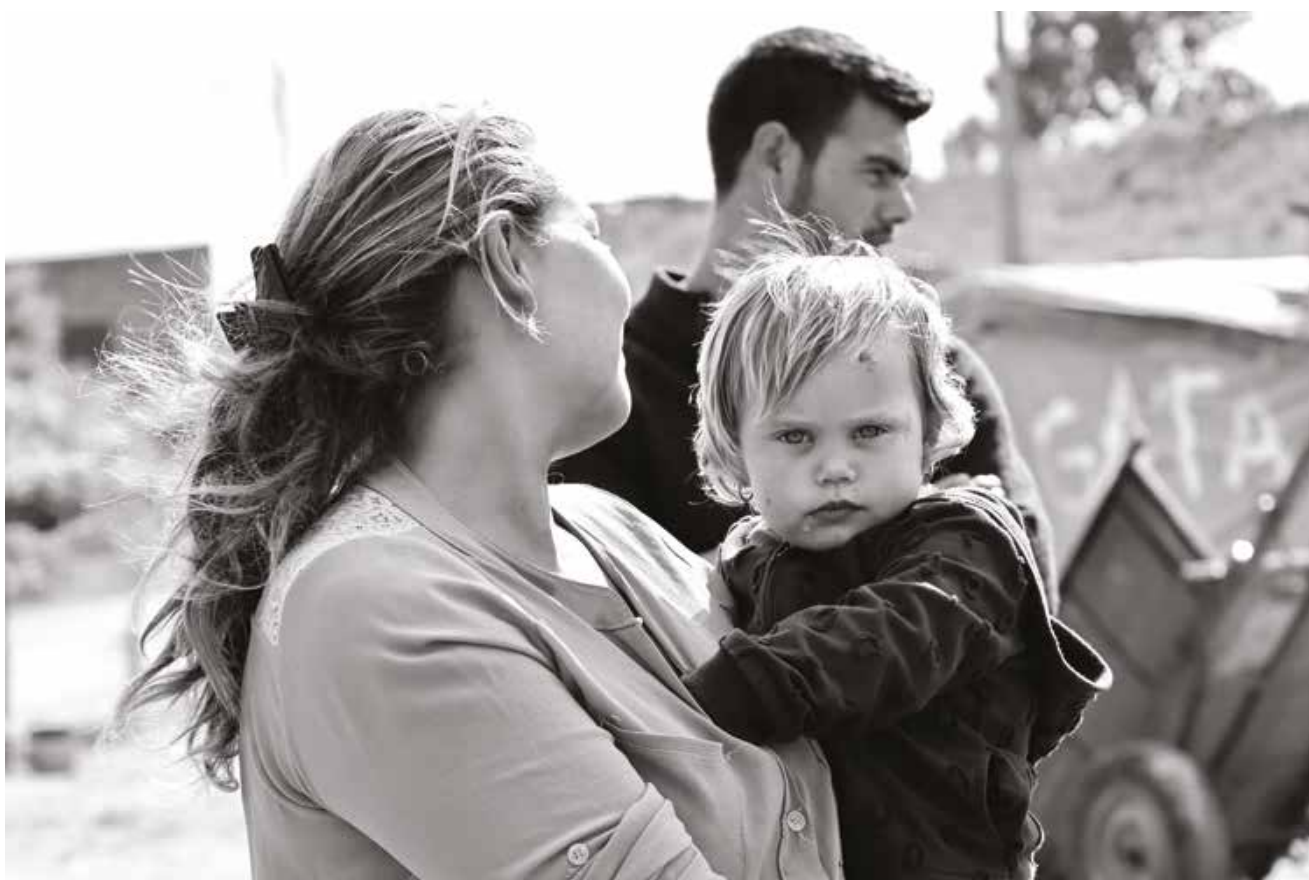
Olho por olho (abr.2019)