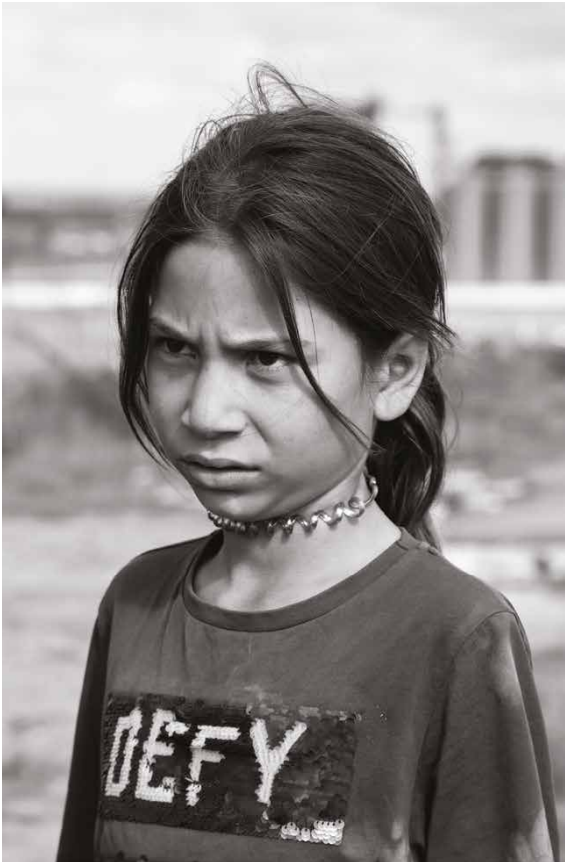
Against all odds (abr.2019)