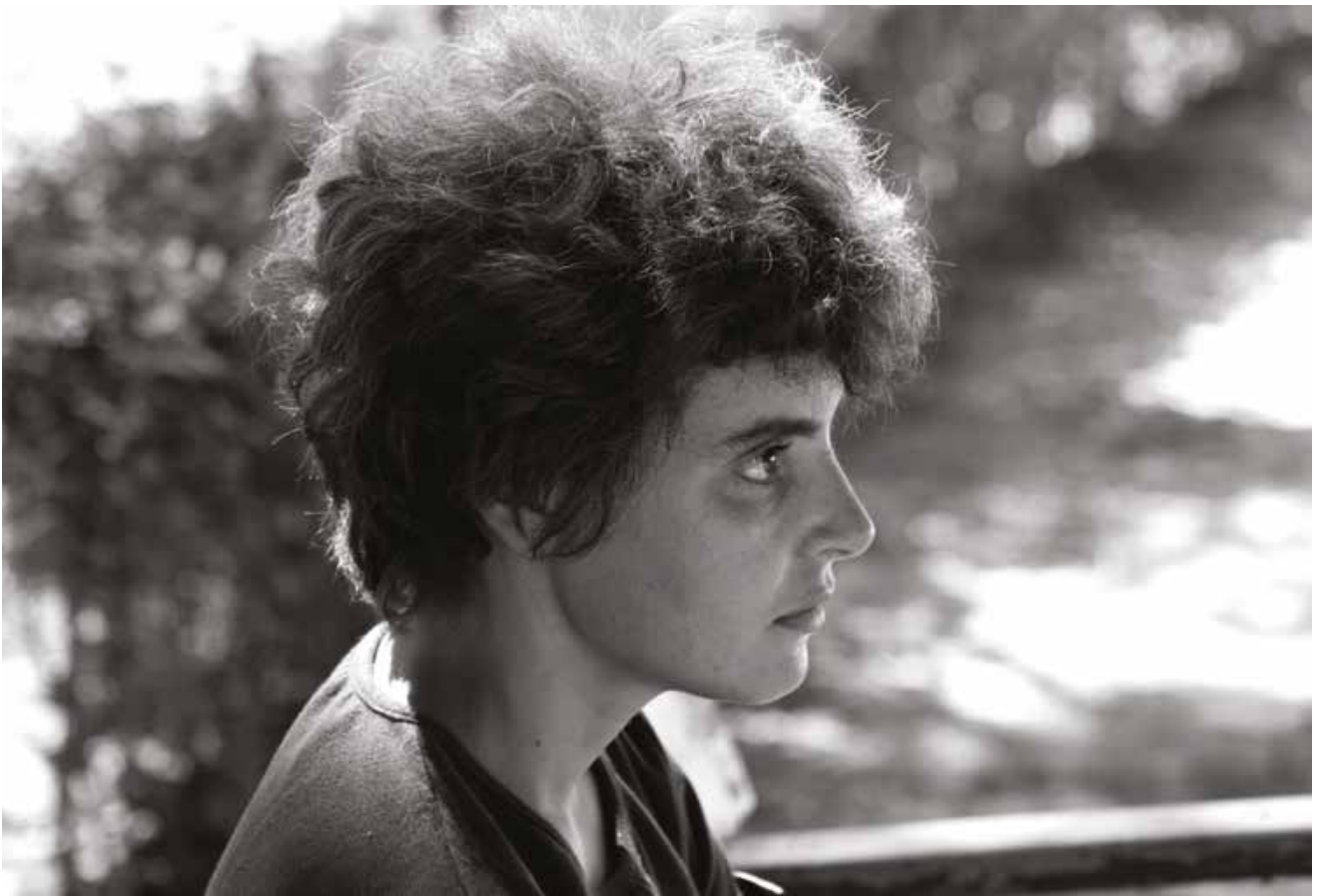
Não te movas (jul.2010)