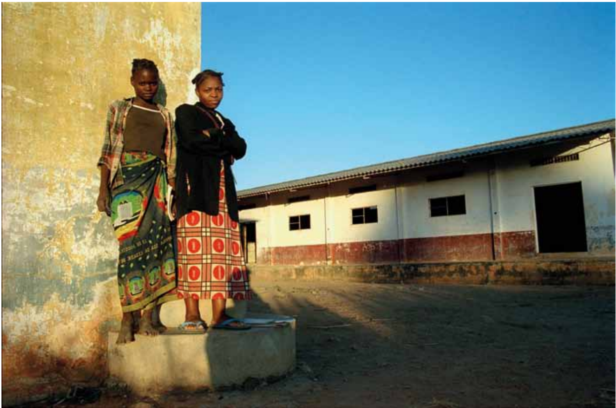
SÉRIE TERRA INCÓGNITA. ESCOLA SECUNDÁRIA DE MARRUPA. "DEPARTAMENTO FEMENINO", 2001-2005