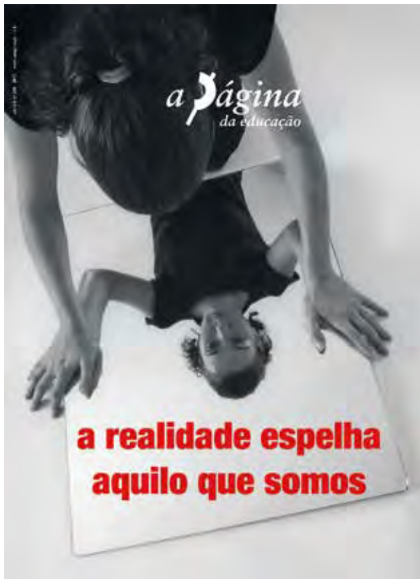
Capa: Fotografia de Adriano Rangel