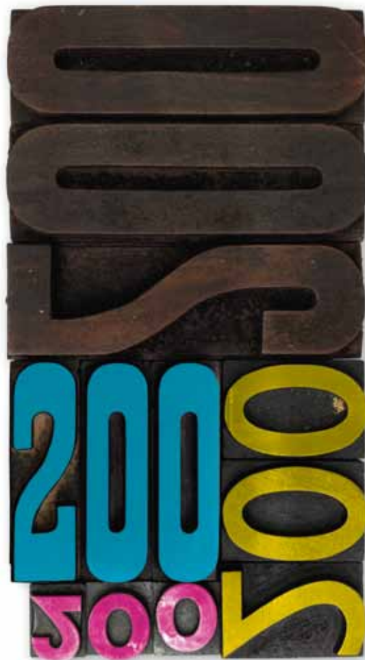
Ilustração tipográfica de Adriano Rangel, a partir de tipos móveis, em madeira e chumbo.

Obra original, expressamente criada em março de 2013, para assinalar a edição 200 d’ A Página da Educação . Pós-produção digital de Rui Moreira.